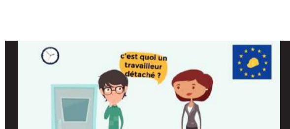
Épisode 1 : Le travail détaché