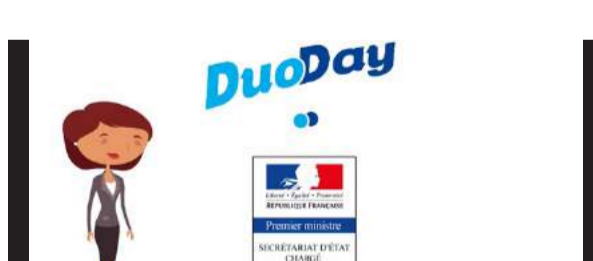
Épisode 3 : DuoDay