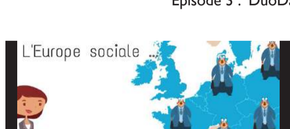
Épisode 2 : L'Europe sociale