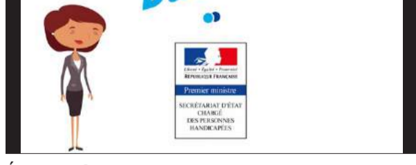
Épisode 1 : Le travail détaché