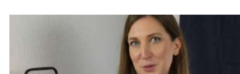
L'artisanat, moteur de la relance économique ! - 19 juin 2020