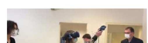
Soutien aux commerçants et restaurateurs du Marché Central à Nancy - 11 juin 2020