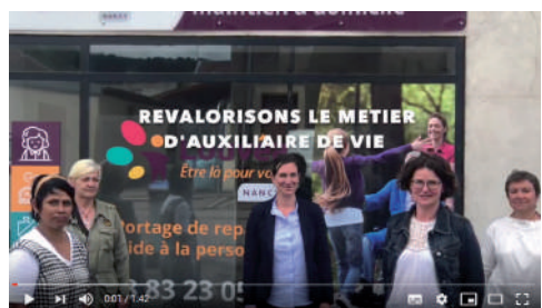
Pour la revalorisation du métier d'auxiliaire de vie à Louvéa à Custines - 4 juin 2020

Pour vous désinscrire de la newsletter, merci de nous le faire savoir par retour de mail