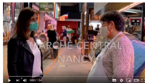
Soutien aux commerçants et restaurateurs du Marché Central à Nancy - 11 juin 2020