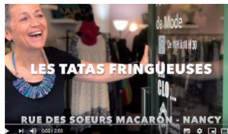
L'artisanat, moteur de la relance économique ! - 19 juin 2020