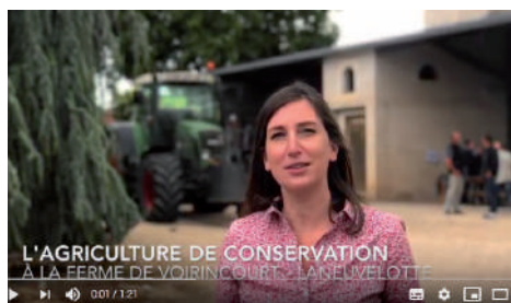
L'agriculture autrement à la Ferme de Voirincourt à Laneuvelotte - 8 juin 2020