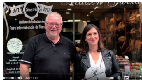
Aux côtés des artisans de la boulangerie - pâtisserie Gwizdak à Nancy - 11 juin 2020