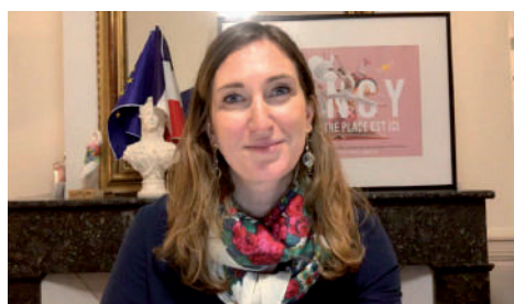
Meilleurs voeux 2022 !