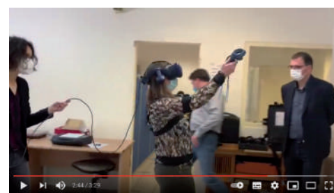
La santé et la prévention au travail chez TEA - 18 janvier 2021