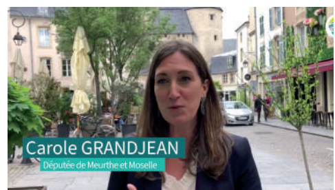
Nos commerçants s'engagent - 1er juin 2021