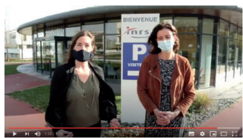
La Santé au Travail à Nancy - 2 novembre 2020