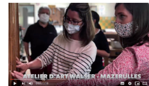
Aux côtés des artisans des Ateliers d'Art Walsler à Mazerulles - 8 juin 2020